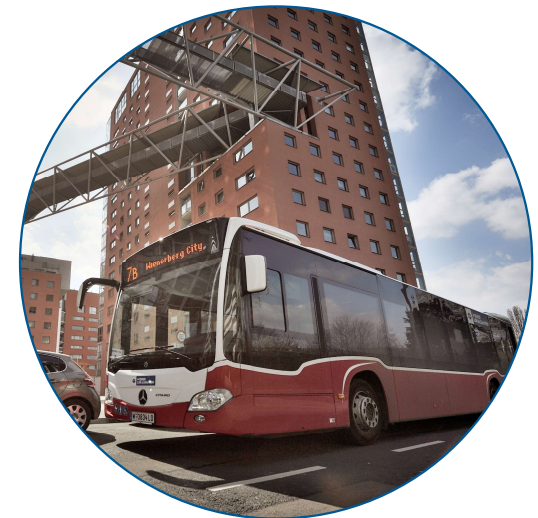
Linienbusbetrieb im Auftrag der Wiener Linien