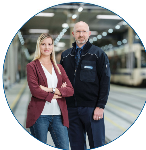
Standort- und Personalvermietung