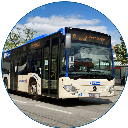
Stadtverkehr Baden im Auftrag des Verkehrsverbund Ostregion