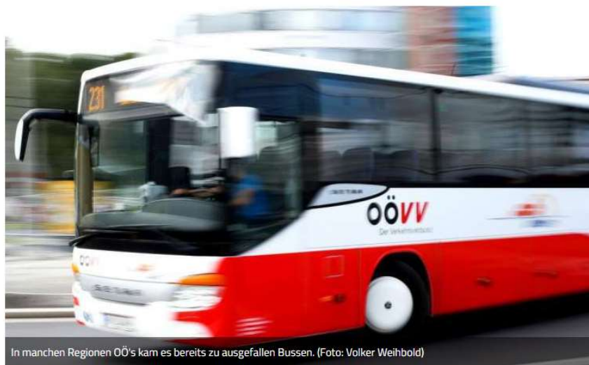
In manchen Regionen ÖÖ's kam es bereits zu ausgefallenen Bussen.

Personalmangel bei Busfahrern – „Billigstbieter-Prinzip überdenken“