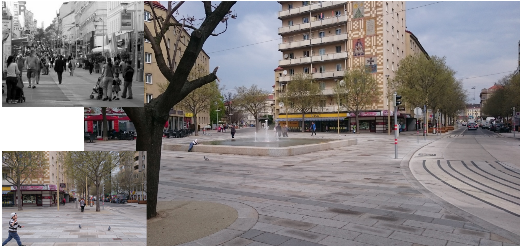
Meidlinger Hauptstraße neu

Stärkung sozialräumlicher Aspekte, Berücksichtigung von NutzerInnenbedürfnisse, Verankerung in der StVO