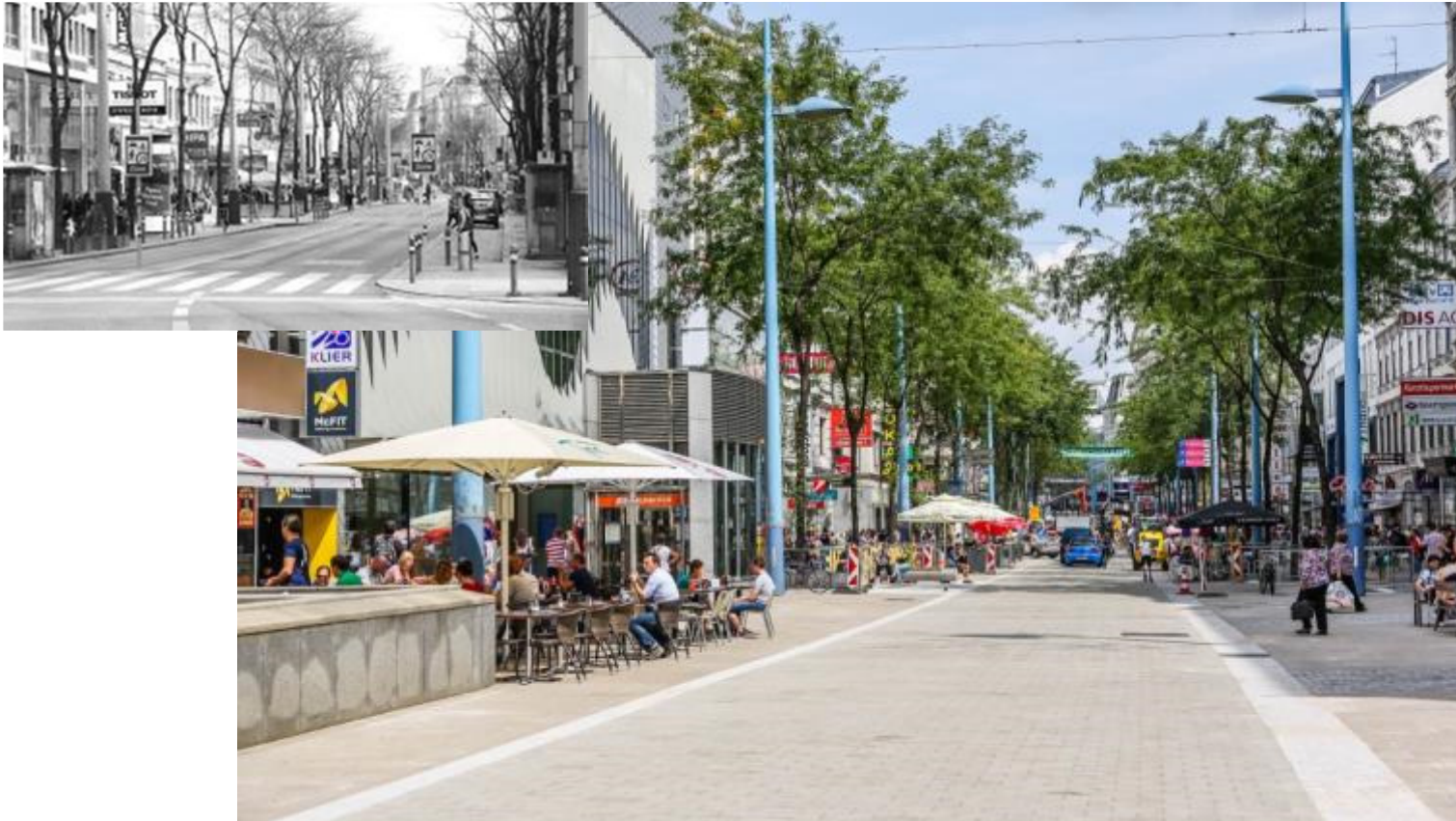
Mariahilfer Straße neu

Vermehrte Ausweisung von Begegnungszonen oder ähnlichen Maßnahmen zur Förderung des Miteinanders