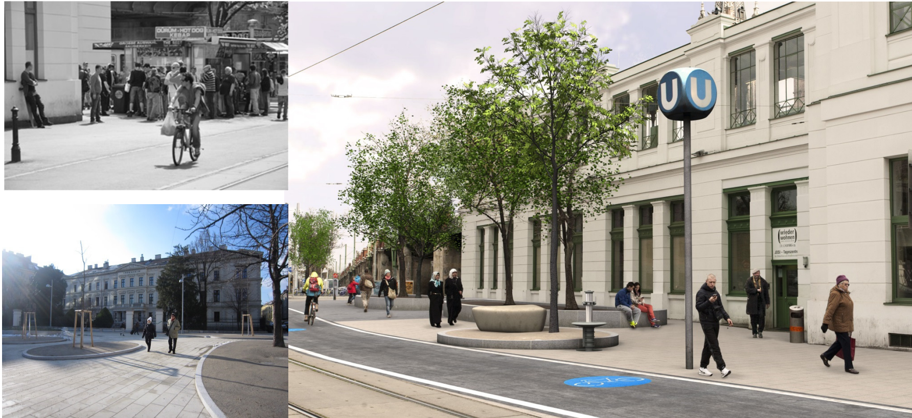
Stationsumfeld U6-Josefstädter Straße

Stärkung sozialräumlicher Aspekte, Berücksichtigung von NutzerInnenbedürfnisse, Verankerung in der StVO