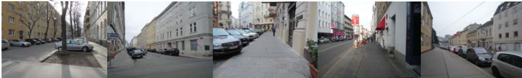
Wiener Querschnitt – Spezifika im Wiener Straßenraum (Boku, Institut für Landschaftsarchitektur, 2014)