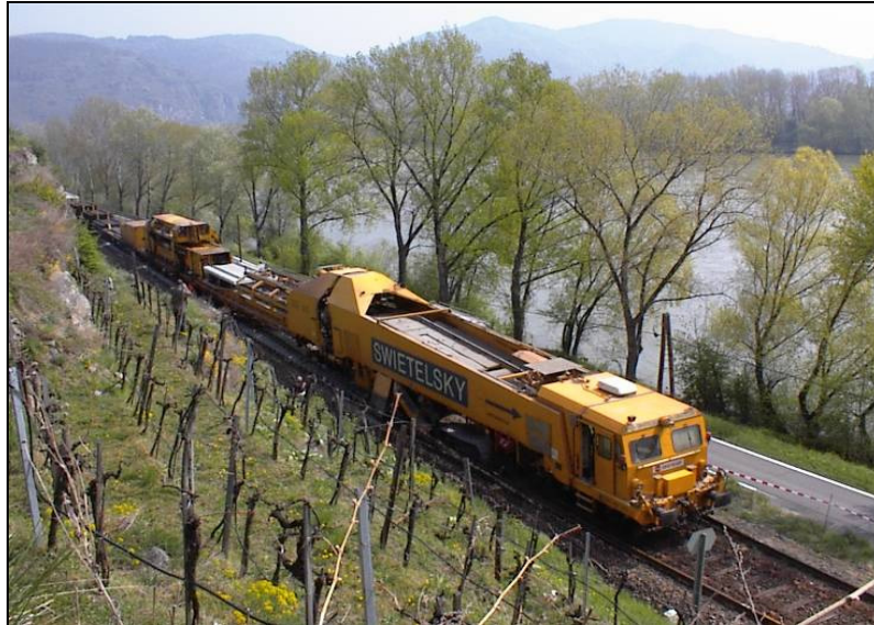
Pose de la voie par le train de renouvellement rapide SUZ 500

Les travaux pourront être observés en toute sécurité à partir d'une zone pour visiteurs balisée aménagée au niveau du parvis de la gare de Klaus.