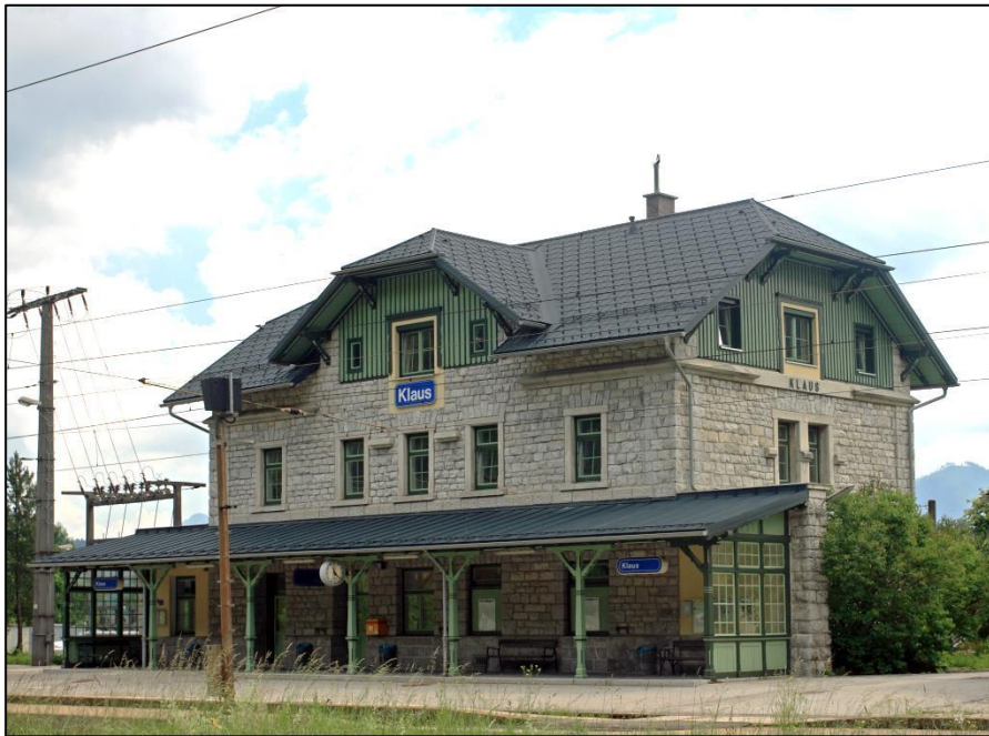
Haltestelle Klaus a. d. Pyhrnbahn

V_{\min} = 70 \text{ km/h} 22,5 t Achslast R = 240 \text{ m} \theta = 21 \text{ ‰} 10 Mio GBT/Jahr